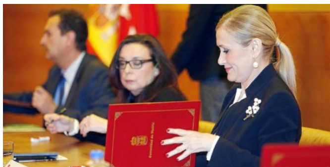
La presidenta regional, Cristina Cifuentes, ayer durante la firma del acuerdo con los sindicatos de Educación