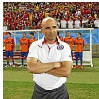
Chile preparará su Copa América en España Marca