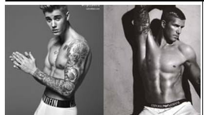
Justin Bieber tras los pasos de David Beckham... ¿con Photoshop?