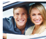
¿Buscas seguro de coche? Seguros de coches al mejor precio garantizado.