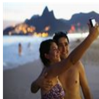
Los hombres que comparten muchos 'selfies' son...