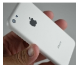
¿Date un carpricho! Este curioso truco para conseguir gangas está arrasando en España. Lo hemos probado.