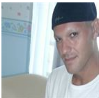
Bruce Sprignsteen, la fuerza de Frank Cuesta que...