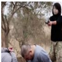
El Estado Islámico publica un vídeo en el que un...