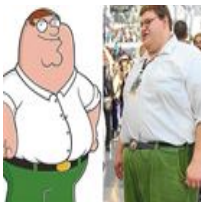
VÍDEO: El Peter Griffin real que arrasa en Youtube,...