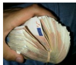
9.745 € por mes? ¡En Madrid, una madre soltera gana 9.745 € por mes desde su casa! Encuentra el tuyo!