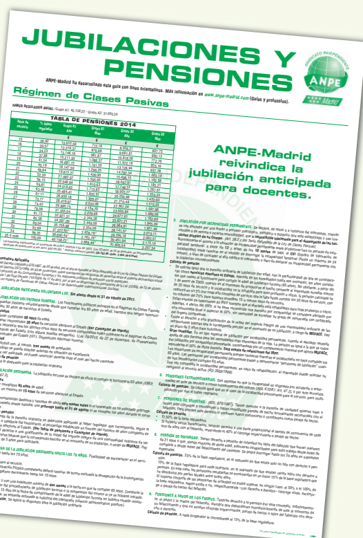
Jubilaciones y pensiones