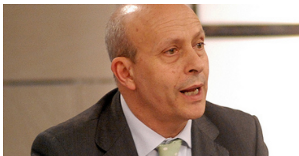
José Ignacio Wert, ministro de Educación

Poco ha durado la nueva propuesta educativa de Ignacio González . El presidente de la Comunidad de Madrid había planteado que cualquier titulado universitario pudiera acceder a las oposiciones a maestro, aunque el Ministerio de Educación ha desechado esta idea. En el borrador sobre la selección de funcionarios docentes que ha