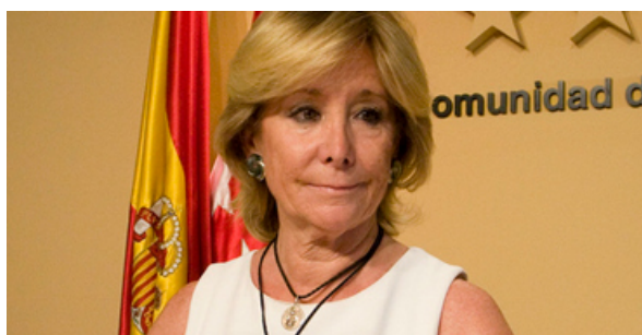
Esperanza Aguirre, expresidenta de la Comunidad de Madrid

Los profesores madrileños están hartos de los 'feos' que les hace Esperanza Aguirre cada vez que puede. Si hace una semana la presidenta del PP de Madrid acusaba a los docentes de no estar preparados para dar clase y apoyaba la propuesta de su sucesor en la Comunidad, Ignacio González, para que cualquier titulado universitario pueda ser docente, esta semana pedía una "liberalización" del sistema de selección de maestros para que se pudiese contratar a nativos si eran "mejores" que los españoles. Los profesores se han cansado de estas críticas y han asegurado que la 'lideresa' cuestiona su trabajo para ocultar el fracaso del Programa Bilingüe que ella misma puso en marcha.