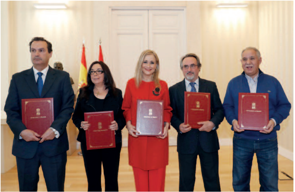
Acto de la firma del Acuerdo Sectorial Docente, el 9 de enero de 2018. La presidenta regional con los presidentes y secretarios generales de los sindicatos firmantes (ANPE, CCOO, CSIF y UGT).