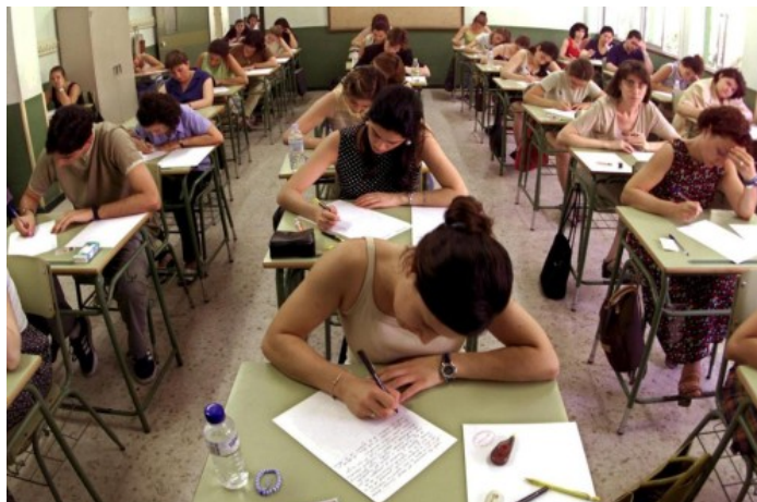
Imagen de archivo

La Mesa Sectorial de Educación entre la Consejería y los sindicatos ha alcanzado un acuerdo para recuperar el modelo de "alterna" en las oposiciones al cuerpo de funcionarios docentes de la región y hacer que un año separe Secundaria y otro para maestros. A su vez, la administración ha transmitido a los sindicatos que está abierto a aplicar la rebaremación de todas las listas de interinos en caso de alcanzarse un acuerdo sobre un nuevo sistema de