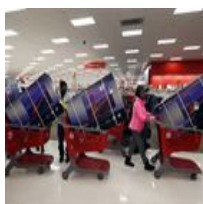
Cómo conseguir cupones de descuento en Internet