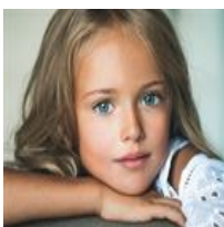
Kristina Pimenova, la niña más guapa del mundo,...