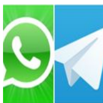
Diez motivos por los que Telegram es mejor que WhatsApp