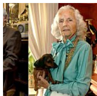
Más de 40 Borbones ilegítimos elmundo.es