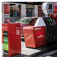
Las cinco grandes mentiras de la gasolina barata Expansión