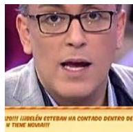
'GH VIP': Belén Esteban revela que Kiko Hernández... La Vanguardia