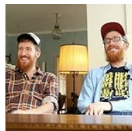
Cómo aprendieron 18 idiomas estos gemelos ingleses Babbel