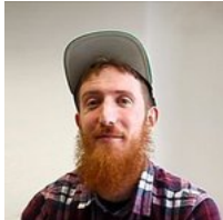
Trucos y consejos para aprender cualquier idioma Babbel